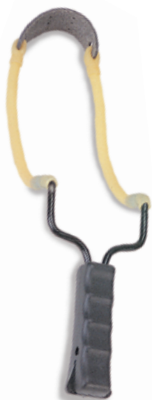
450140 - Fionda David. Impugnatura sagomata elastico tondo