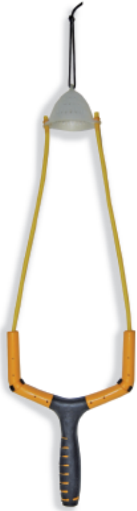
450151 Fionda adjustable large 450152 Fionda adjustable small