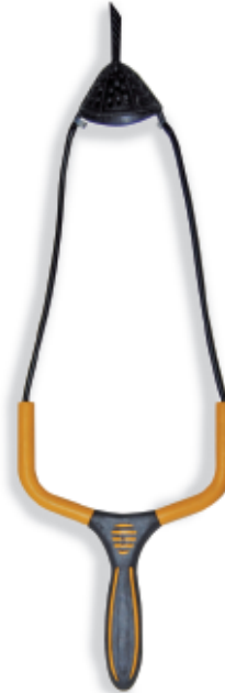
450157 Fionda twin tower large 450158 Fionda twin tower small