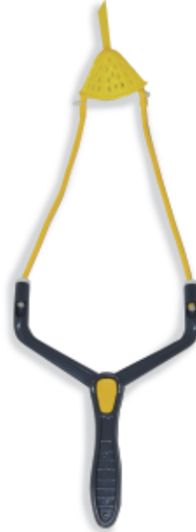
450063 Fionda Camor Mod. Twin 3