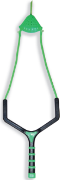
450153 Fionda specific baitpult small 450154 Fionda specific baitpult large