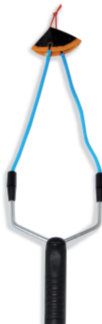
450068 Fionda Camor Mod. Power Catty