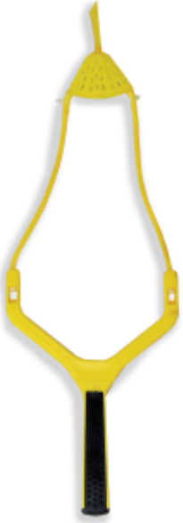
450060 Fionda Camor Mod. Speedy