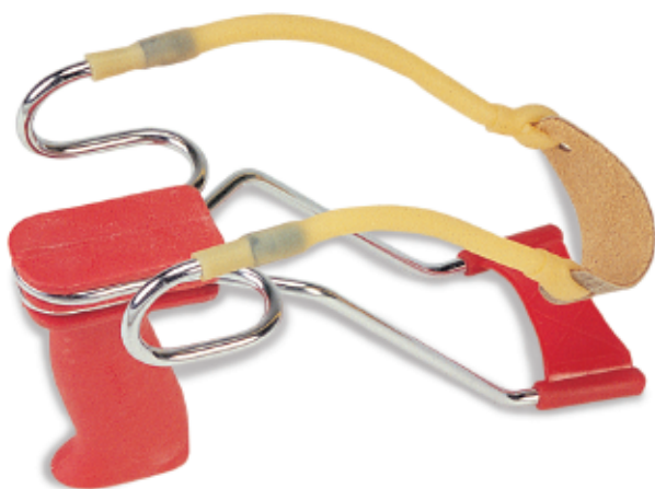
450143 - Fionda Golia con appoggiabraccio. Forcella standard