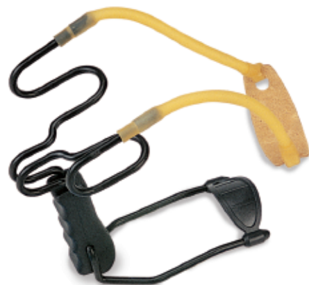
450142 - Fionda Dragon. Con appoggiabraccio. Elastico tondo