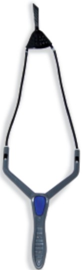
450065 Fionda Camor Mod. Twin 1