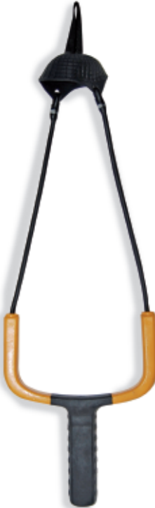
450155 Fionda passion heavy n.1 450156 Fionda passion heavy n.2