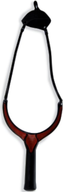
450061 Fionda Camor Mod. Oval Plus