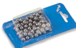
450148 - Sfere acciaio mm. 7,9