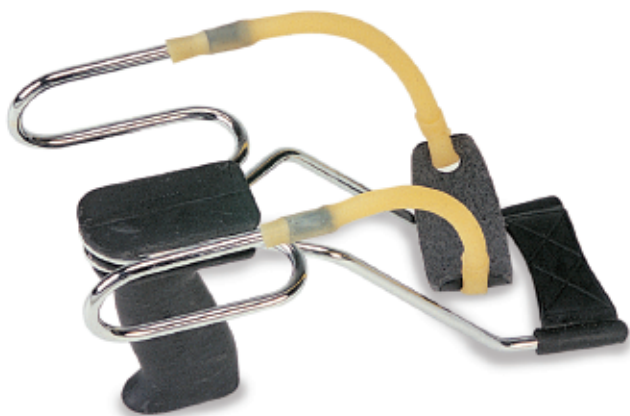
450144 - Fionda Golia super con appoggiabraccio forcella lunga