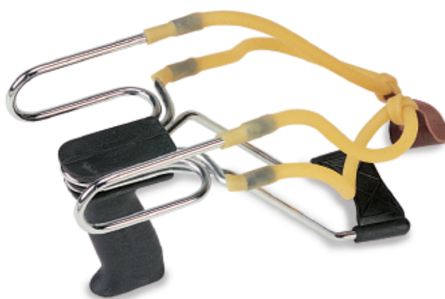
450145 - Fionda Golia doppia. Elastico tondo doppio. Con appoggiabraccio