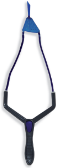
450064 Fionda Camor Mod. Twin 2