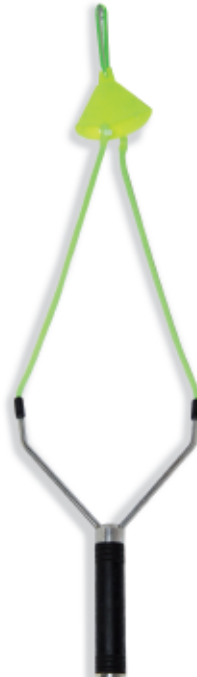
450067 Fionda Camor Mod. Carp