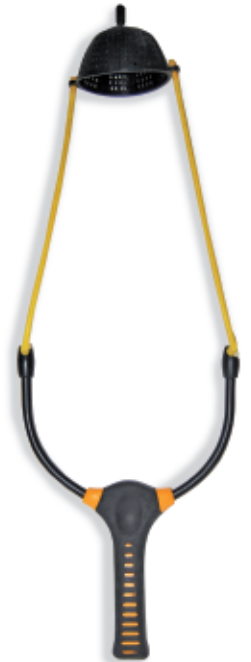
450159 Fionda match master