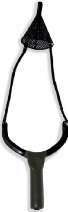
450062 Fionda Camor Mod. Control