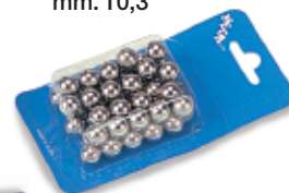
450149 - Sfere acciaio mm. 10,3