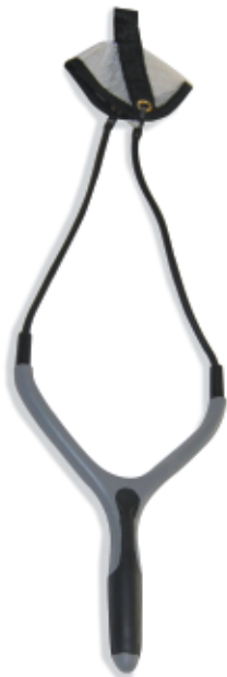
450066 Fionda Camor Mod. Demon