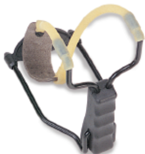
450141 - Fionda Target. Impugnatura sagomata con appoggiabraccio. Elastico tondo